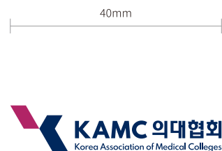
최소크기 규격 : 40mm

KAMC의 기본 이미지를 바탕으로 새로운 의대협회 KAMC 의대협회에서 앞장선 비전 인격 구현을 위한 새로운 이미지를 연구하는 작업을 하고 있습니다. 보라색, 그라, 블루 : 의료